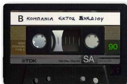
De laatste kopie van de Ektós Schedíou -opnamen

Destijds was restaurant Symposion een Grieks ontmoetingspunt in Groningen. Het viertal speelde als eerste hier en in verwante Griekse restaurants in Leeuwarden en Amsterdam. Ook werden er wat concertjes voor hen geregeld, onder