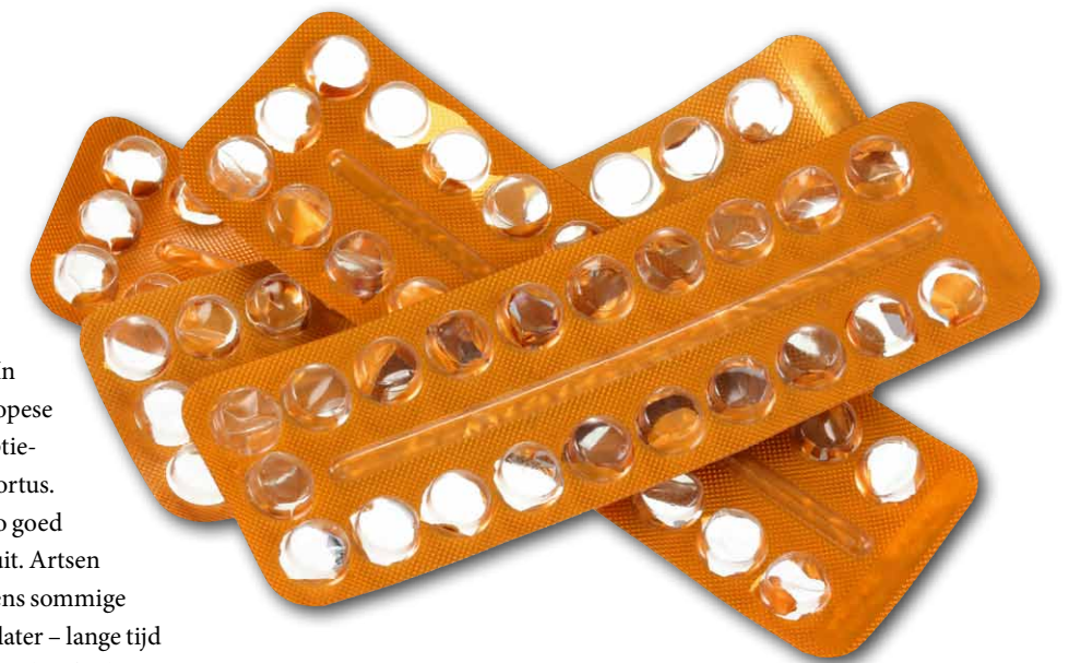
In 1980 werd de anticonceptiepil in Griekenland gelegaliseerd