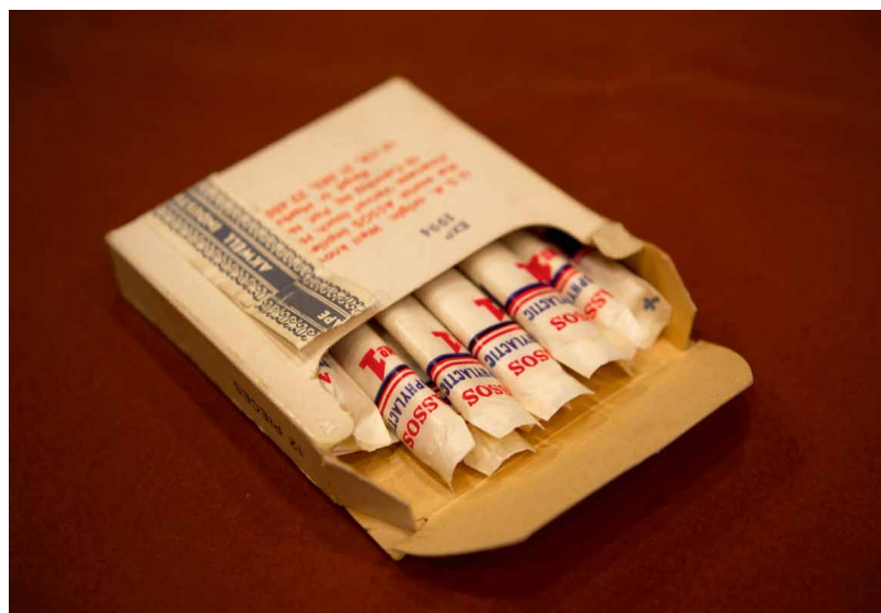
Condooms, 'vermomd' als sigaretten