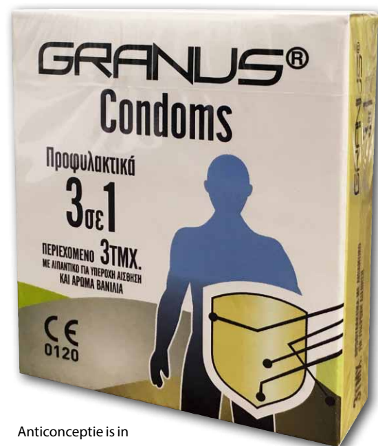
Anticonceptie is in Griekenland een typische mannenzaak